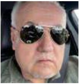
Ing. Fdo. Luis Barragán